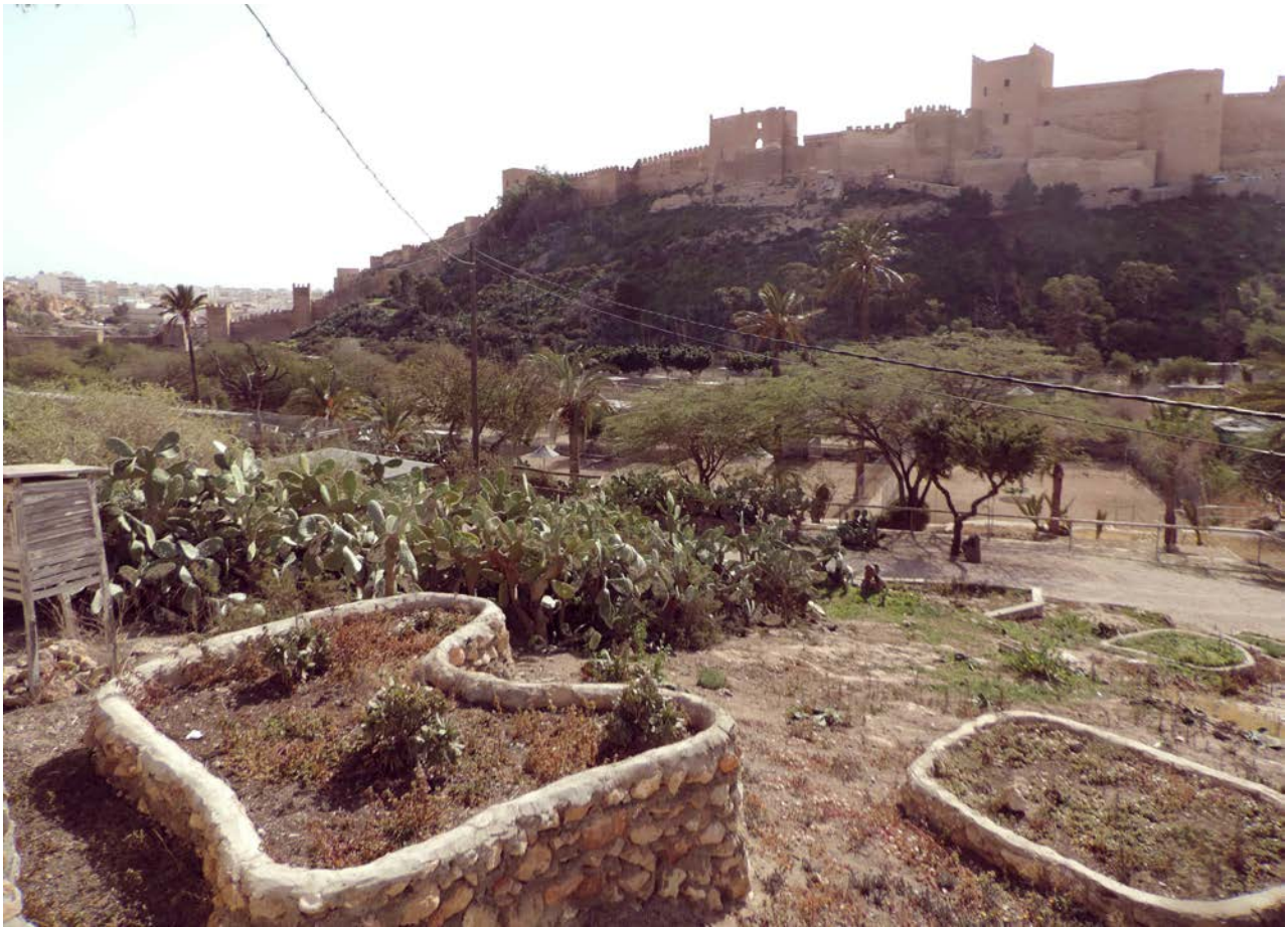
La Estación Experimental de Zonas Áridas (EEZA).

Las personas que impulsaron y pilotaron este proyecto en los primeros años fueron el profesor José Antonio Valverde (sobre todo reconocido por su papel en la creación del Parque Nacional de Doñana y la Estación Biológica del mismo nombre (EBD-CSIC), y Antonio Cano, conservador del museo del IA. Del profesor Valverde se sabe casi todo (ver sus memorias) pero destacaré que los años pasados en el IA, los viajes que en esos años (mediados-finales de los 50 y principios de los 60 del siglo XX) realizó al Sáhara Occidental (por entonces colonia española), así como la amistad que trabó con Antonio Cano, fueron determinantes para la creación del PRFS. El profesor Valverde percibió ya entonces que si no se hacía algo para proteger y salvar el antílope mohor (o gacela mohor, Nanger dama mhorri ), esta especie emblemática y única desaparecería. Por su parte, Antonio Cano era una rara avis no solo en el IA sino en su propia ciudad. De formación abogado pero de corazón naturalista, con grandes habilidades para la fotografía y la comunicación y, sobre todo, una persona inquieta y fiel amigo. Cuando el profesor Valverde le propuso embarcarse en la arriesgada aventura del salvar el antílope mohor, no lo dudó.