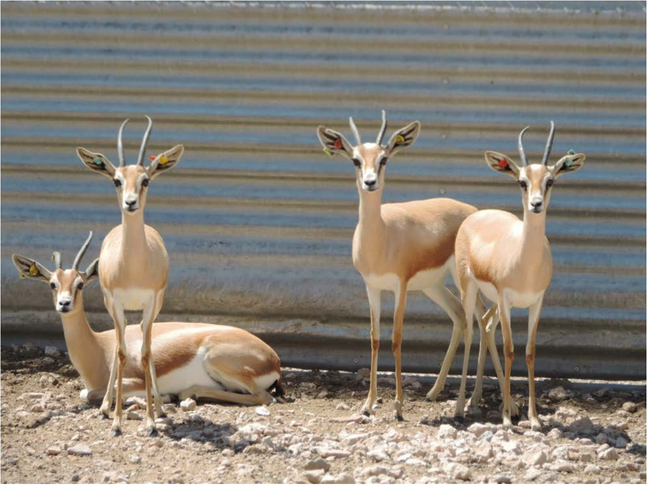
La gacela dorca.

La gacela de cuvier es también llamada gacela de montaña o gacela del Atlas pues ocupa estas cadenas montañosas que se extienden por el norte de Marruecos, Túnez y Argelia.