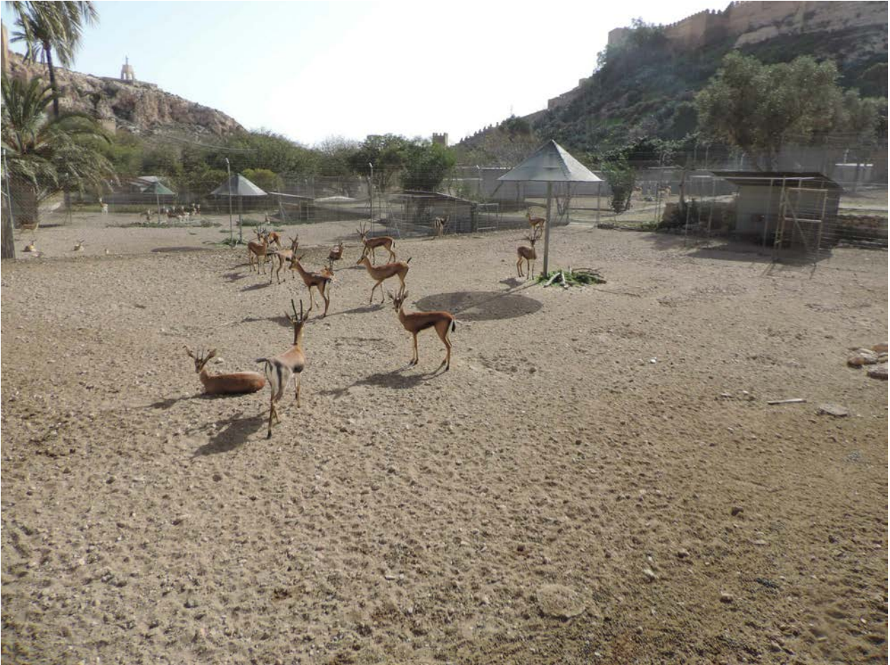
La gacela de cuvier.